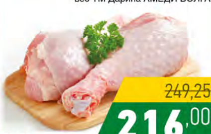
Зам. «Голень цыплят-бройл» вес ТМ Дарина АМЕДИ ВОЛГА