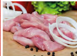
Зам. «Поджарка свиная» 5кг