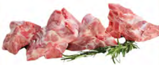
Зам. «Рагу из свиный» вес Мяспром