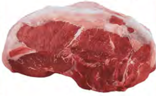
Зам. «Говядина тазобедренный отруб» вес Купець