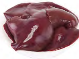
Зам. «Печень свиная» вес Мяспром