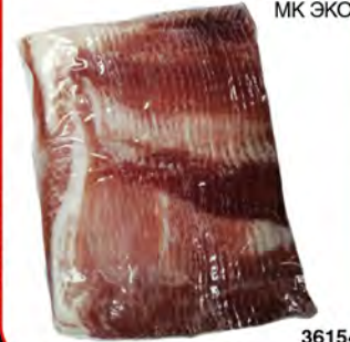
Бекон с/к 500г МК ЭКО