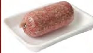
Зам. «Фарш Домашний» вес Мяспром