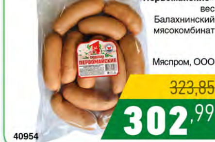
Сардельки «Первомайские» вес Балахнинский мясокомбинат