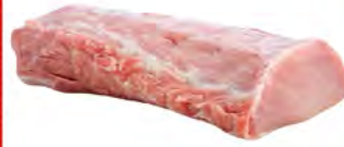
Зам. «Карбонад свиной» вес Мяспром