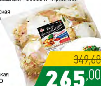
Зам. «Шашлык «Особый «Армения» пакет Павловская Курочка