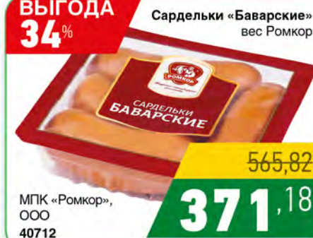
Сардельки «Баварские» вес Ромкор