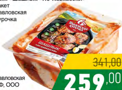
Зам. «Шашлык «По-Кавказски» пакет Павловская Курочка