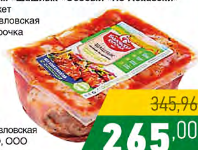
Зам. «Шашлык «Особый «По-Абхазски» пакет Павловская Курочка