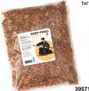
Лук жареный ТМ «Yakima» 1кг