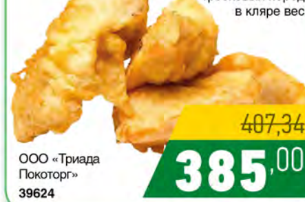
Зам. «РЫБНОЕ ФИЛЕ» тресковых пород в кляре вес