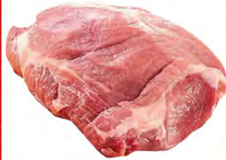
Зам. «Окорок свиной б/к» вес Мяспром