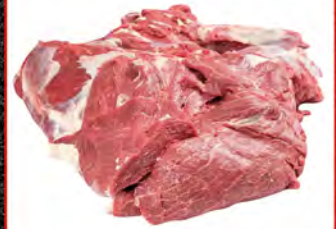
Зам. «Лопатка свиная б/к» вес Мяспром