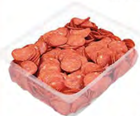
Колбаса Чоризо с/к (полусухая) нарезка 500г МК ЭКО