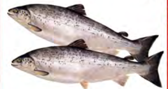
Зам.рыба «Лосось» Чили 4-5кг 5-6кг