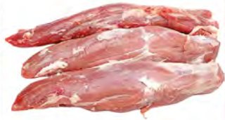
Зам. «Вырезка свиная б/к» вес Мяспром