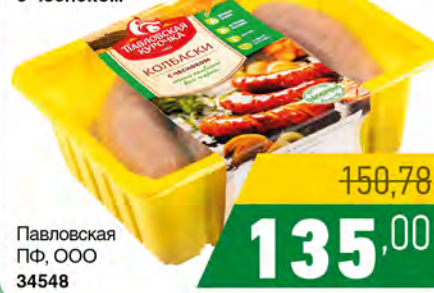
Колбаски для жарки с чесноком