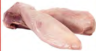
Зам. «Язык свиной» вес Мяспром