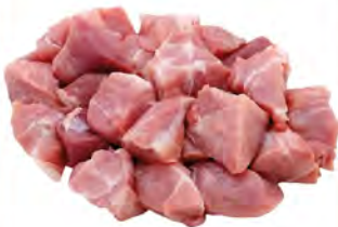
Зам. «Гуляш свиной» 5кг