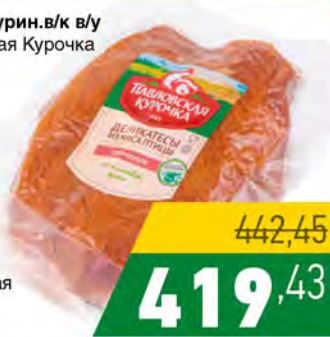
Грудка курин.в/к в/у Павловская Курочка