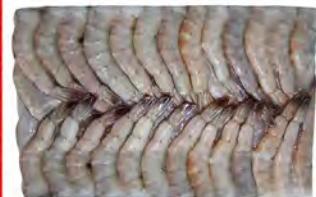
Зам. «Креветки Ванамей» в панцире, б/г, с/м, 21/25, к2, блок 1,8кг