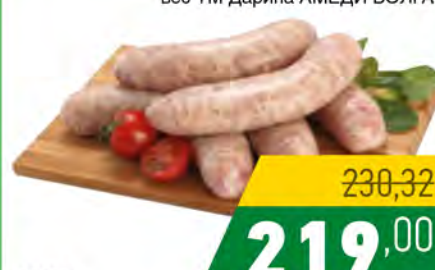
Зам. «Купаты «Дачные» вес ТМ Дарина АМЕДИ ВОЛГА