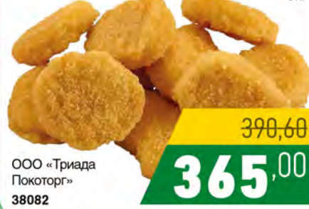
Зам. «Наггетсы из курицы» 5кг