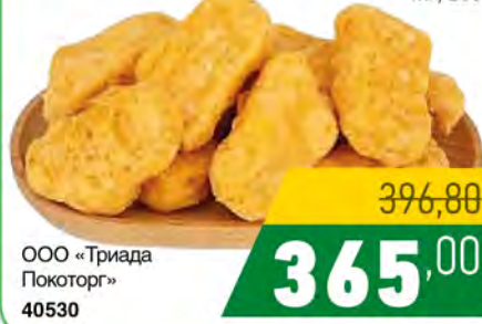
Зам. «Наггетсы из курицы Нежные» 4кг, вес