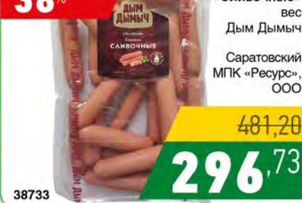
Сосиски «Сливочные» вес Дым Дымыч Саратовский МПК «Ресурс», ООО