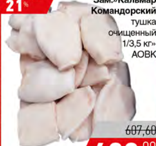
Зам.»Кальмар Командорский тушка очищенный 1/3,5 кг» АОВК