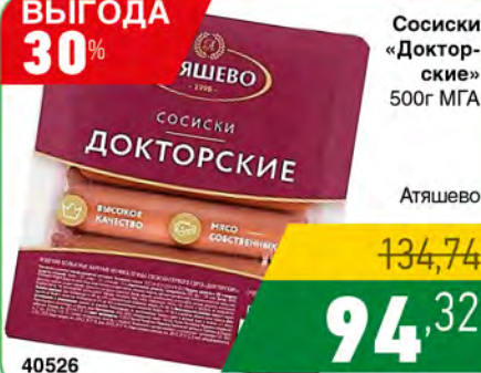
Сосиски «Докторские» 500г МГА