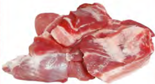
Зам. «Мясо котлетное свиное» вес 80/20 Мяспром