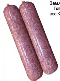
Зам. Фарш Говяжий вес Купець