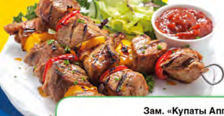
Зам. «Купаты Appetитные» вес Мяспром